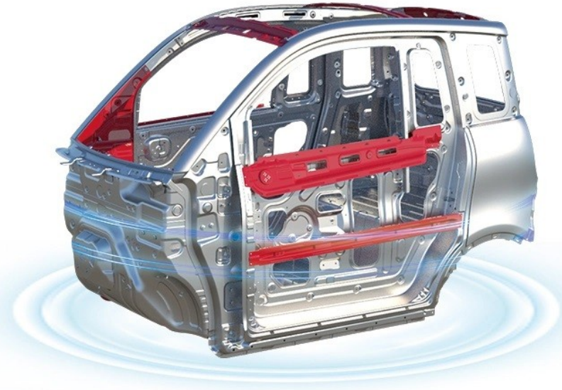
AUTOMOBILE-GRADE PROFILE DESIGN INTEGRATED STAMPING CAGE BODY